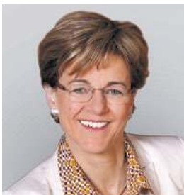
Verena Herzog Nationalrätin