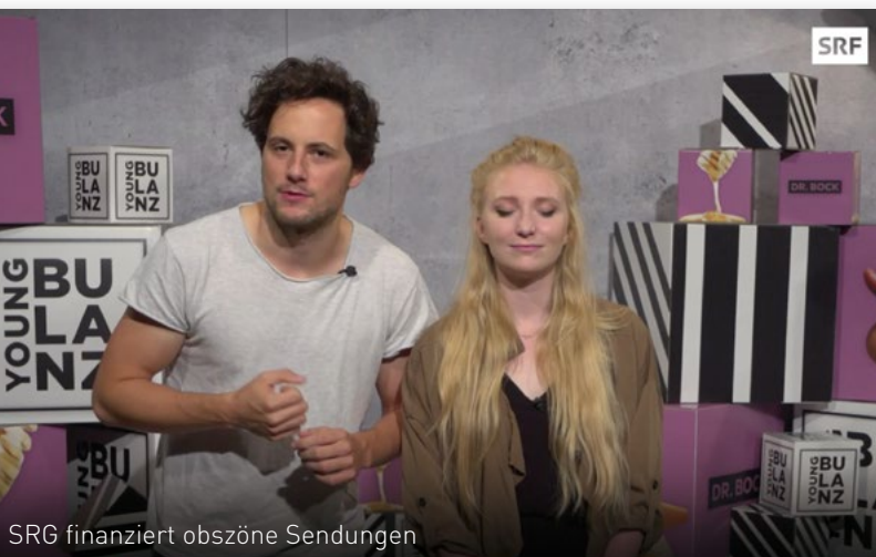
SRG finanziert obszöne Sendungen

Ich wünsche Ihnen ein gesegnetes Weihnachtsfest im Kreise Ihrer Liebsten und einen guten Rutsch ins neue Jahr.