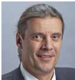
Oskar Freysinger, Initiativkomitee